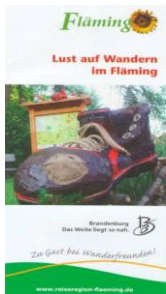
Faltblatt „Lust auf Wandern“ (Tourismusverband Fläming e.V.)