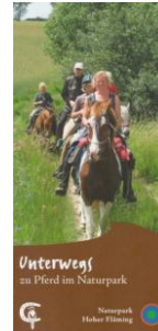
Faltblatt „Unterwegs zu Pferd im Naturpark“