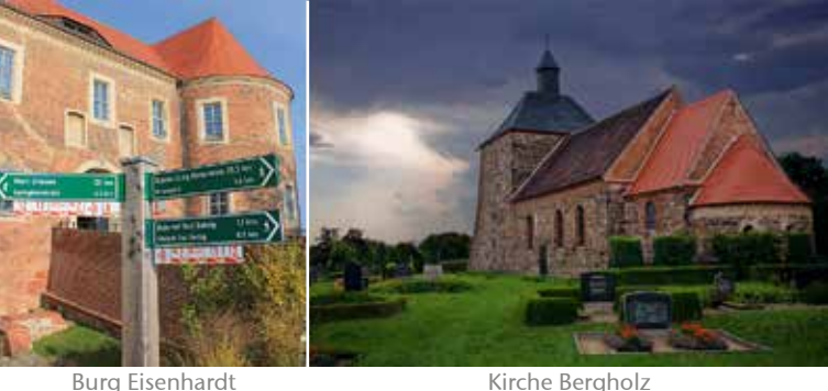
Burg Eisenhardt Kirche Bergholz Wiesenburger Schlosspark Kunstwanderweg