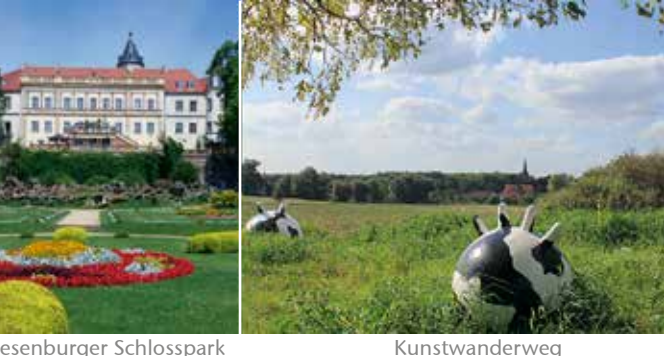
Burg Eisenhardt Kirche Bergholz Wiesenburger Schlosspark Kunstwanderweg