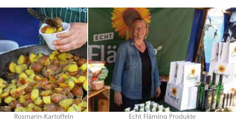
Rosmarin-Kartoffeln Echt Fläming Produkte Spinnen Musikverein Ziesar

(Die Barrierefreiheit auf der Tour ist leider sehr eingeschränkt.) www.reiseregion-flaeming.de